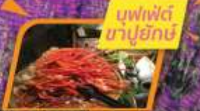
บุฟเฟ่ต์ ซาปูยักซี่