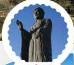
อุชิคุ โดบุสึ