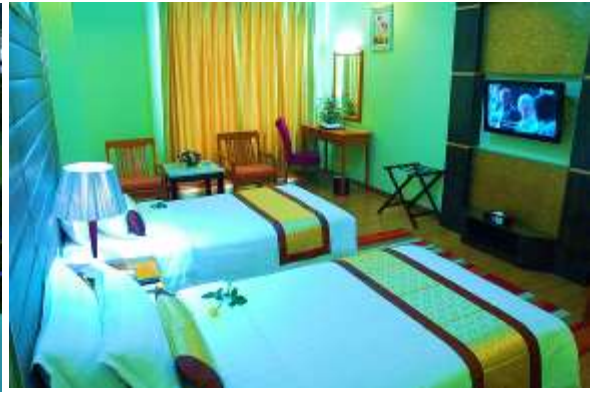
พักที่ SKY STAR HOTEL หรือเทียบเท่าระดับ 4 ดาว